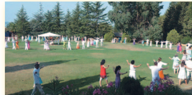
La danse de la paneurythmie

Le Maître Omraam Mikhaël Aïvanhov explore la nature humaine dans son environnement, à l'échelle individuelle, familiale, sociale, planétaire : « Ce que je souhaite par cet enseignement, c'est vous donner des notions sur l'existence, sur vous-mêmes, comment vous êtes construits, quelles relations vous avez avec l'univers tout entier et quels échanges vous devez faire avec les autres et avec la vie universelle ».