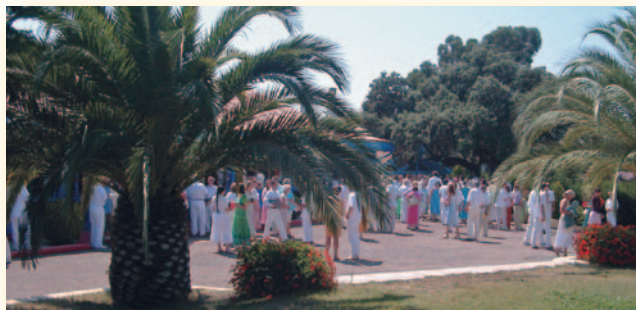
Au centre de Congrès au Bonfin (Fréjus)

La Fraternité Blanche Universelle n'est pas une église, ni une organisation occulte. Il n'y a pas de cérémonies rituelles, ni de hiérarchie, ni de cursus d'études. C'est un mouvement spiritualiste ouvert. Il prend en compte la diversité des humains mais aussi ce qui les rassemble. Il propose une nouvelle vision du monde et des moyens pour la concrétiser.