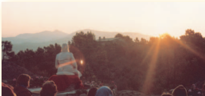
Méditation au lever de soleil

Par son exemple, son rayonnement, son enseignement et les clés qu'il donne pour résoudre les problèmes de chaque jour, il a ouvert et ouvre encore à d'innombrables personnes le chemin de l'épanouissement intérieur.