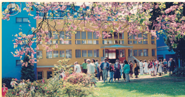
Au centre d'Izgreve (Paris)

Les Éditions Prosveta ( www.prosveta.com ) diffusent des livres, brochures, CD, DVD... réalisés à partir des conférences orales d'Omraam Mikhaël Aïvanhov. Ces ouvrages sont traduits dans plus de 30 langues et sont disponibles en librairie.