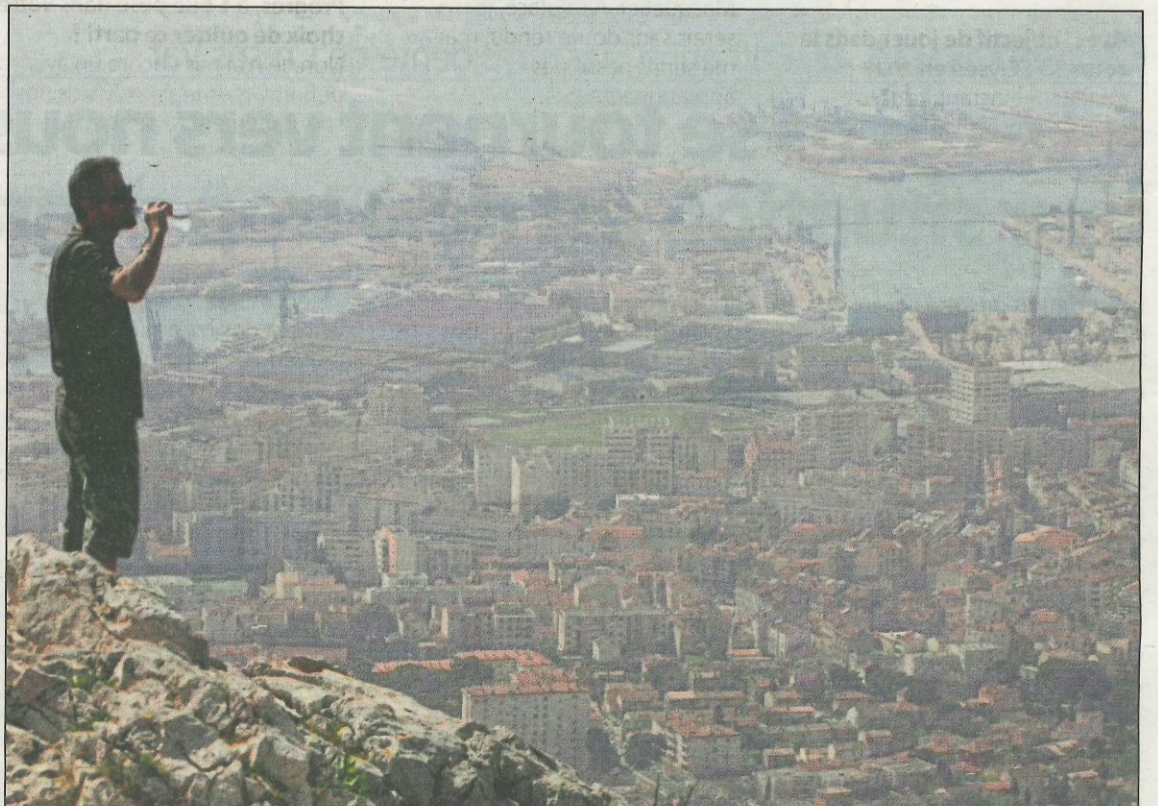
En alerte de niveau 1 et 2, plusieurs recommandations sont prises comme la baisse de 20 km/h des vitesses maximales ou l'interdiction stricte de brûler des déchets verts.

Les départements voisins des Bouches-du-Rhône et du Vaucluse ont suivi la même trajectoire tandis que les Alpes-Maritimes ont d'abord été placées en seuil d'information-recommandation mardi, puis en alerte de niveau 1 mercredi et